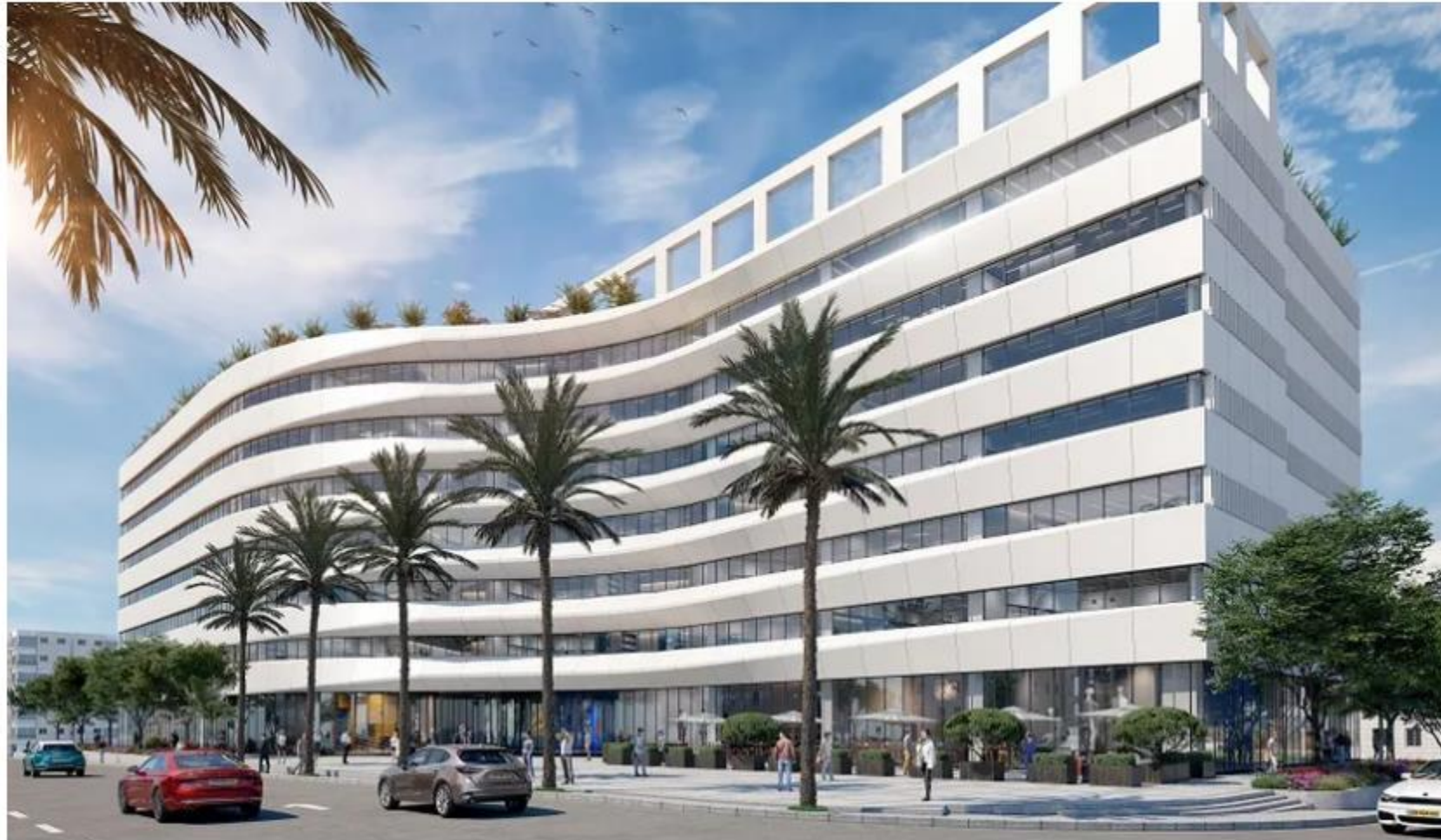
הדמיית אמות גבעתיים: VIEW POINT